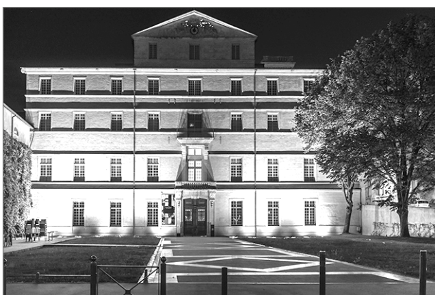
Le musée Fabre