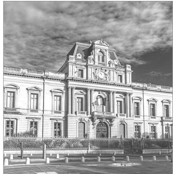
La Place Martyrs de la Résistance dans la rue Foch