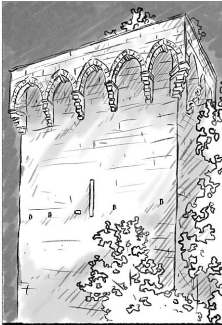
La tour des Pins

Visitez la tour des Pins, la cathédrale Saint-Pierre et la Faculté de Médecine.