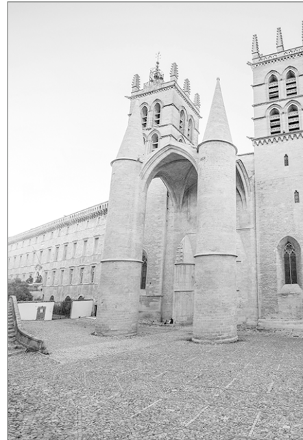
La cathédrale Saint-Pierre

a Qu'est-ce qu'il y a entre le square et la rue? | Was trennt die Grünfläche vor dem Museum von der Straße?