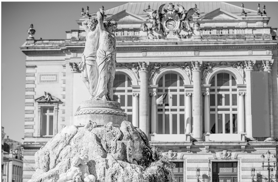
L'Opéra Comédie et La Fontaine (Brunnen) des Trois Grâces

Visitez la place de la Comédie. Regardez autour de la Fontaine des Trois Grâces et de l'Opéra Comédie.