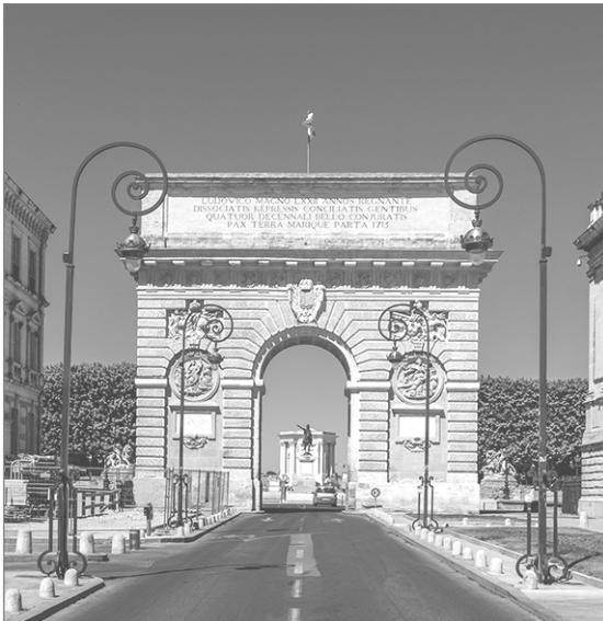
L'Arc de Triomphe (Triumphbogen) dans la rue Foch

Visitez la rue Foch avec l'Arc de Triomphe et la place Martyrs de la Résistance.